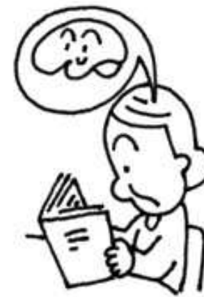
Ilustración de TAI TAKAHASHI